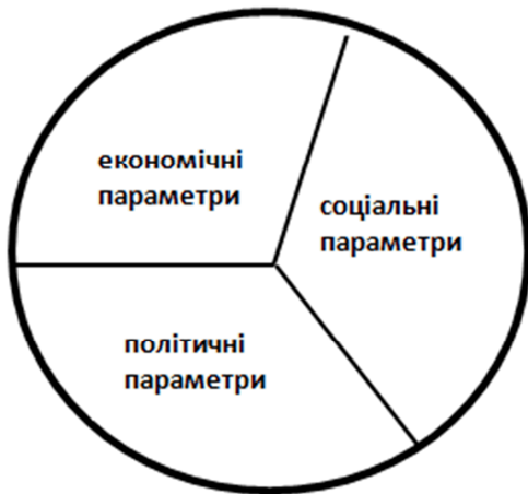
Рисунок 2 – Основні параметри якості влади

В загальному вигляді, напевно, параметри якості влади можна умовно розбити на три основні групи (рис. 2).