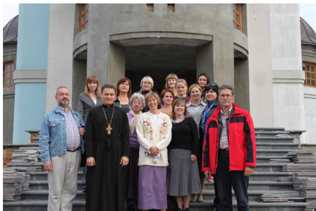
Участники семинара у входа в церковь Троицы

Главная задача Ассоциации – научить христианских медсестер и волонтеров ведению здорового образа жизни, профилактике заболеваний, заботе о людях с психологическими и психосоматическими проблемами, детей и инвалидов, а также оказанию палиативной помощи.