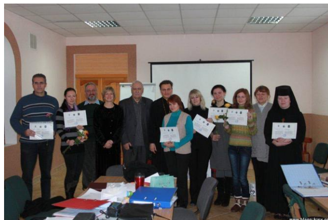
Участники получившие сертификаты