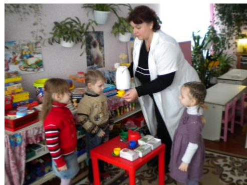
Вживання вітамінних чаїв та напоїв