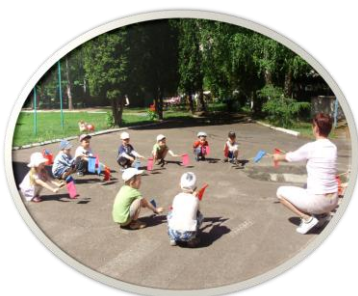
Ранкова зарядка на спортивному майданчику