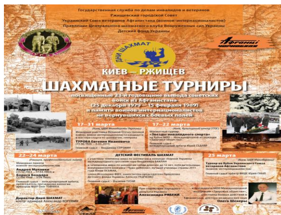
Организаторы шахматных турниров посвященных «23-й годовщине вывода Советских войск их Афганистана» (Украина, 2012)