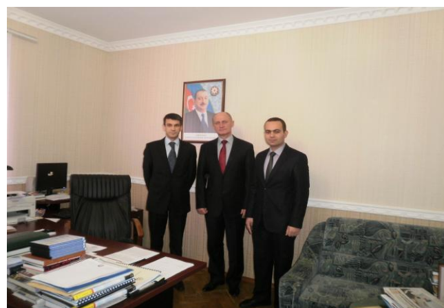
Зустріч у Посольстві Азербайджанської Республіки в Україні Встреча в Посольстве Азербайджанской Республики в Украине