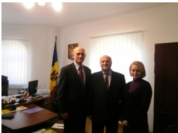
Зустріч у Посольстві Республіки Молдова в Україні Встреча в Посольстве Республики Молдова в Украине