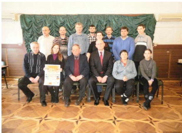
Участники и организаторы турнира "Звезды инвалидного спорта" (Украина, 2012)