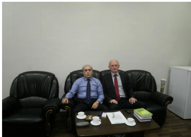
Зустріч у Посольстві Республіки Вірменії в Україні Встреча с Посольстве Республики Армении в Украине