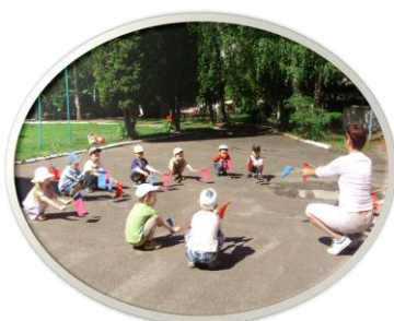
Утренняя зарядка на спортивной площадке