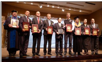
Тайбэй, Тайвань 10 декабря 2012 г. Награждение лауреатов - 2012 «Международной премией Inventor»

Основные направления совместной деятельности, предусмотренные международными соглашениями МОО-МАЗО: сотрудничество в области международного открытого образования, в том числе создание соответствующих учебных центров; внедрение в практику разных государств современных международных методик и стандартов подготовки специалистов, а также других совместных научно-исследовательских, издательских, рекламно-информационных проектов; открытие представительств МОО-МАЗО в разных странах мира.