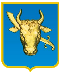
Управление образования Прилуцкого городского совета