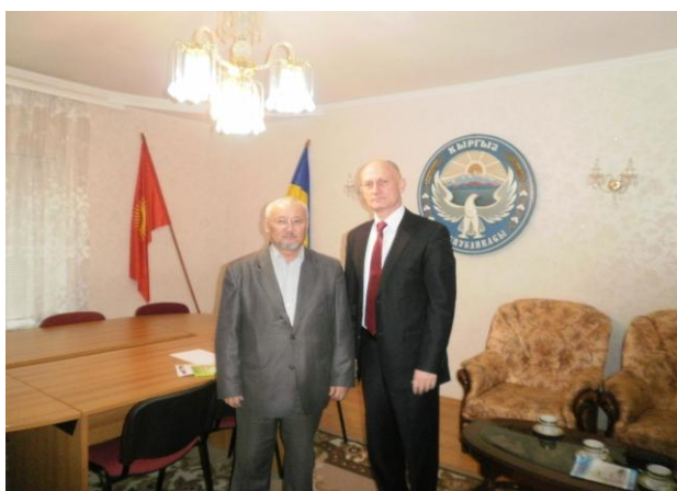
Зустріч у Посольстві Киргизької Республіки в Україні Встреча в Посольстве Кыргызской Республики в Украине