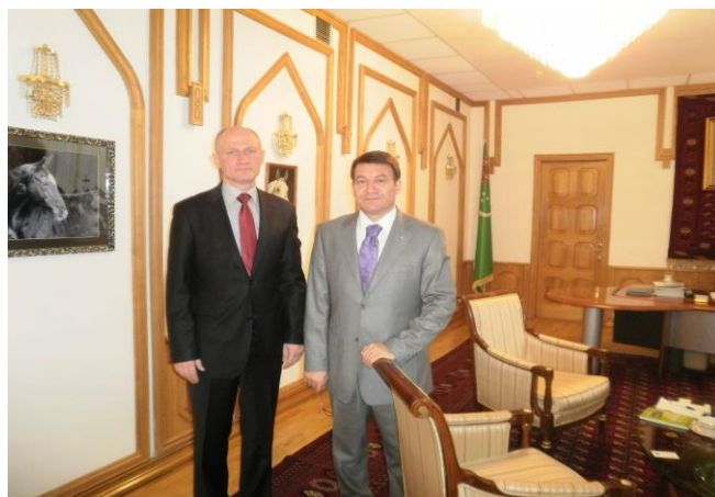
Зустріч у Посольстві Республіки Туркменістану в Україні Встреча в Посольстве Республики Туркменистана в Украине