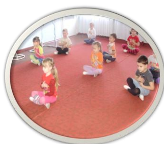
Физкультурный кружок «Лотос»