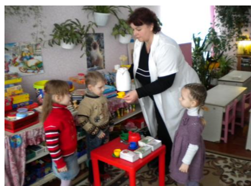
Употребление витаминных чаев и напитков