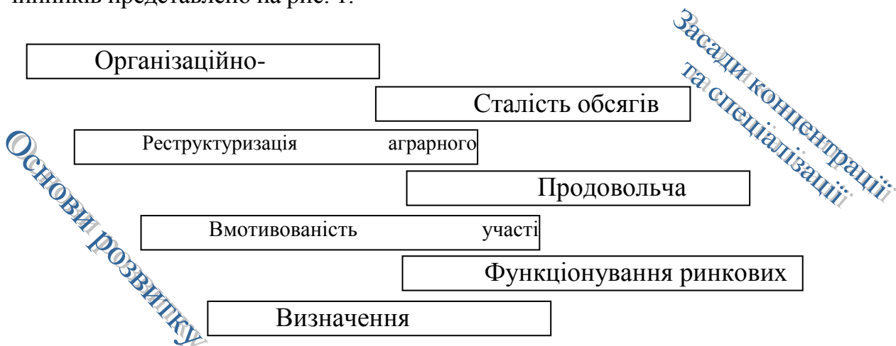
Рис. 1. Загальна схема основних засад структуризації виробництва

Загальну схему структуризації виробництва з врахуванням основних чинників представлено на рис. 1.