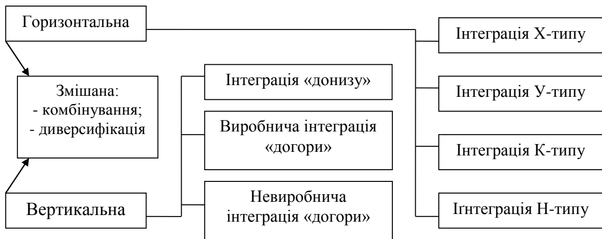
Рис. 2. Типи інтеграції та форми їх розвитку

Усі види інтеграції мають конкретні форми (типи) впровадження [8], рис. 2. При горизонтальній інтеграції У-типу відбувається об'єднання підприємств однієї галузі, які виробляють однакову продукцію або здійснюють одні й ті ж стадії виробництва. Горизонтальна інтеграція Х- або К-типу об'єднує підприємства з випуску взаємопов'язаних товарів, де Х-інтеграція – об'єднання взаємодоповнюючих за масштабами збуту підприємств або напрямів діяльності, К-інтеграція – приєднання підприємства або додаткового напрямку діяльності без зміни основного. Процес об'єднання підприємств різних галузей АПК без наявності виробничої спільності називають горизонтальною інтеграцією Н-типу (конгломератним злиттям). Профілююче виробництво у таких об'єднаннях має розпливчасті контури або зовсім зникає.