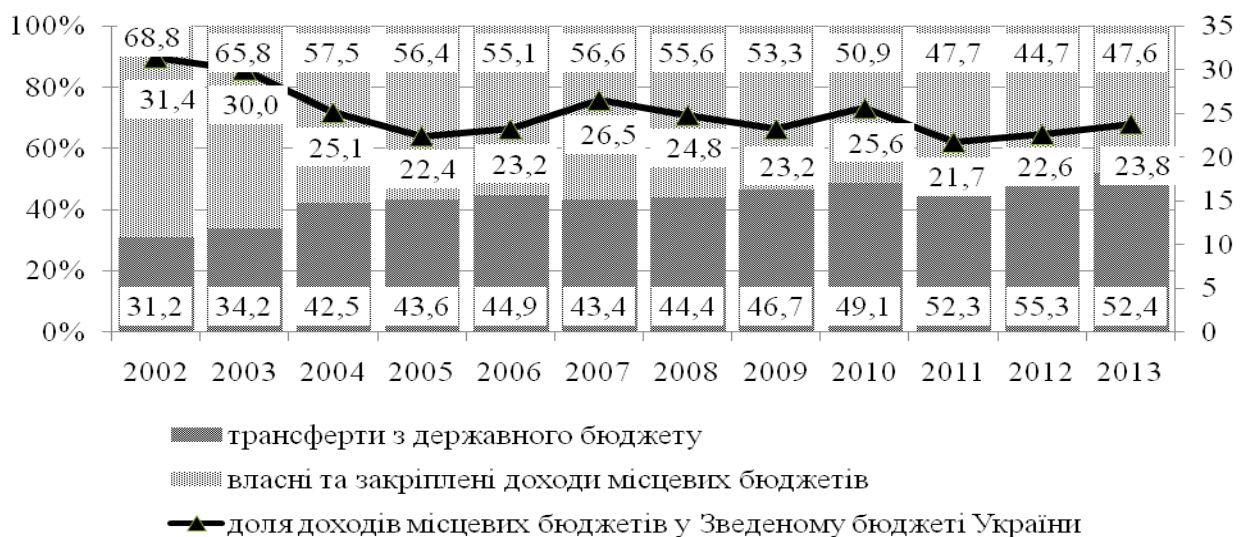
Рис. 1. Структура доходів місцевих бюджетів України та їх доля у Зведеному бюджеті України за 2002 – 2013 рр., у відсотках. [3;4;5;6]

Частка трансфертів з державного бюджету України до місцевих бюджетів за період 2005 – 2013 рр. зросла на 24%, а питома вага доходів місцевих бюджетів у Зведеному бюджеті України за досліджуваний період знизилась майже на 9% (рис. 1.). Вплив зовнішньої фінансової нестабільності 2008 р. віддзеркалювався на економічних процесах України (табл. 1).