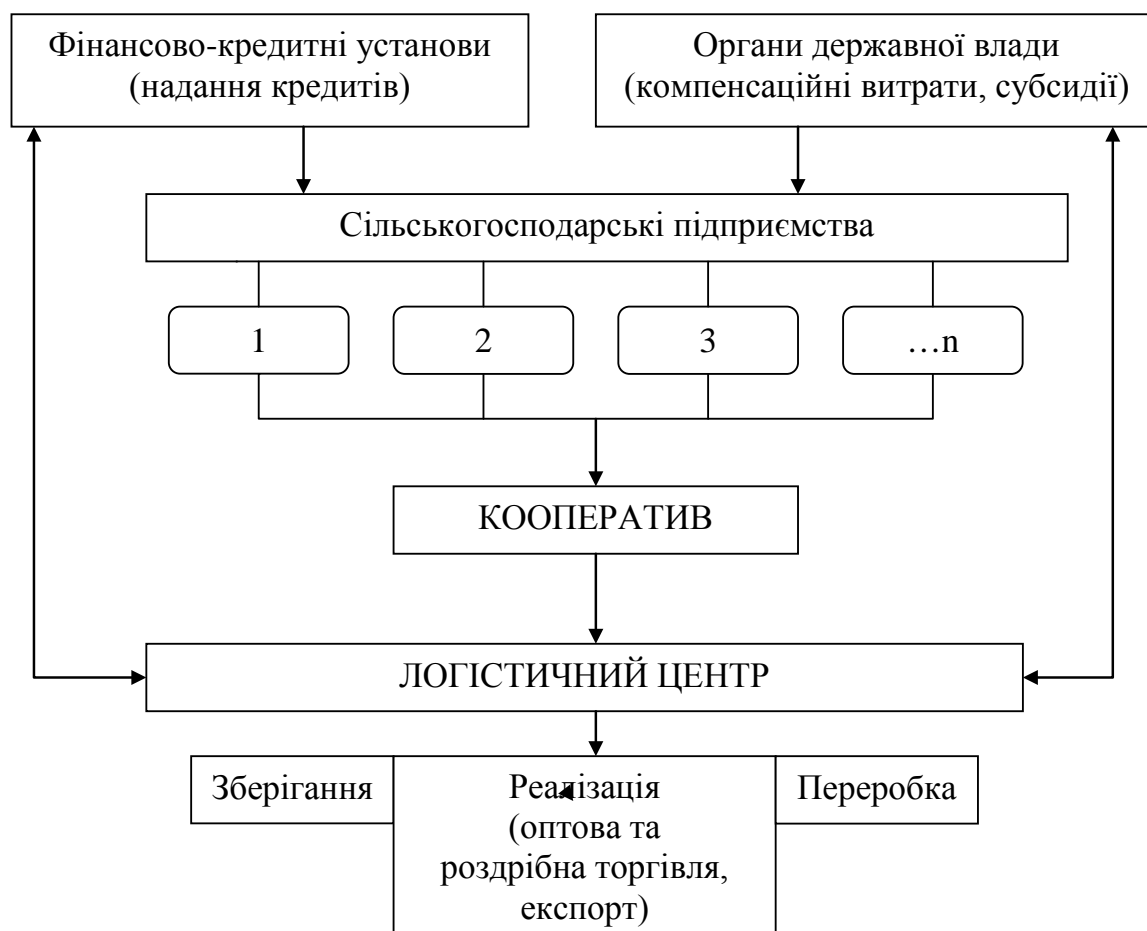
Рис. 3. Функціональна модель логістичного центру підприємств аграрного сектору [8]

Даний логістичний центр є функціональним органом, який повинен забезпечити ринок збуту сільськогосподарської продукції за доступними цінами. Для уникнення значної кількості посередників під час просування продукції до кінцевого споживача необхідно організувати кооператив, що дасть змогу формувати значні обсяги поставок та забезпечити прибутковість своїм членам.