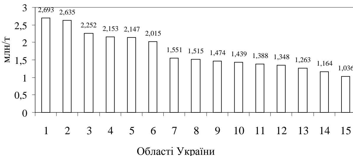
Рис. 1. Топ 15 областей України по зберіганню зерна у 2013 р., млн /т [7]:

За умов збільшення обсягів збору врожаю в Україні важливо нарощувати елеваторні потужності. Згідно Держреєстру, найбільші потужності із зберігання зерна та продуктів його переробки розташовані в Одеській, Полтавській та Вінницькій областях. Черкаська область знаходиться на 11 місці з потужностями в 1 млн 388 тис. т зерна (рис. 1).