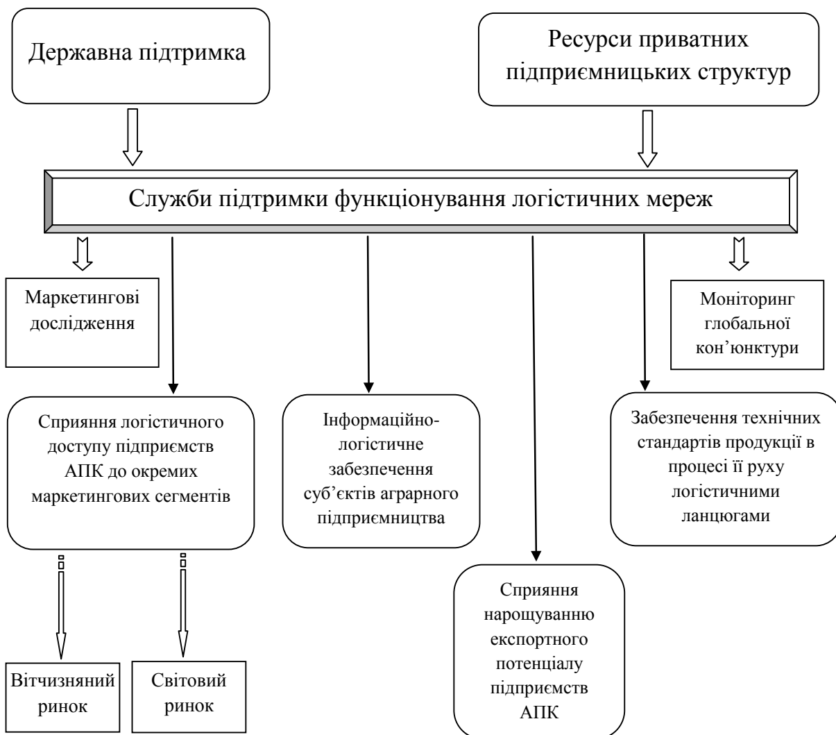
Рис. 2. Напрями діяльності служб підтримки функціонування логістичних мереж у агропродовольчій сфері

Логістична підтримка на зарубіжних ринках забезпечує зміцнення позицій суб'єктів аграрного підприємництва. На нашу думку, доцільно створити спеціалізовані служби підтримки функціонування логістичних мереж, функції яких представлені на рис. 2.