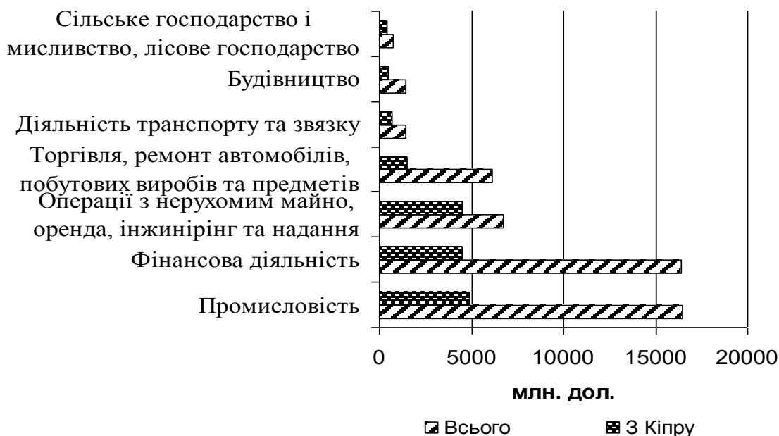
Рис. 1. Обсяг прямих іноземних інвестицій в Україну всього, у тому числі з Кіпру, 2013 р. *

У той же час, збільшення інвестицій з офшорних країн вказує на те, що це є кошти вітчизняних інвесторів, які певним чином використовують недосконалість українського законодавства (рис. 1).