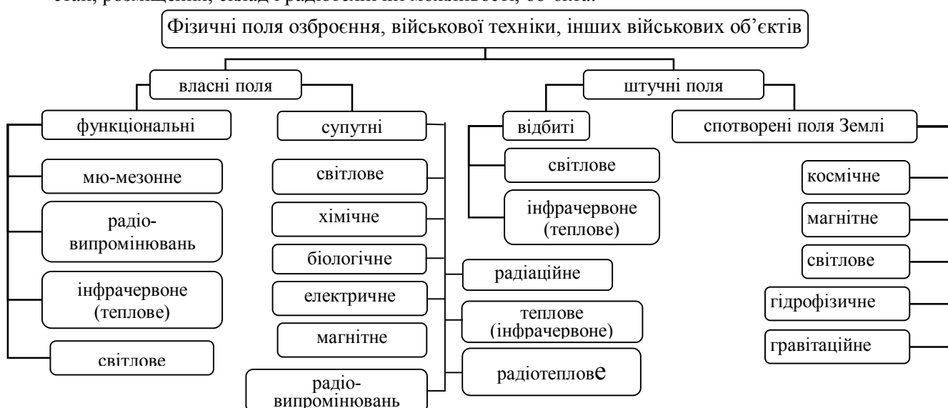
Рис. 1. Фізичні поля озброєння, військової техніки, інших військових об'єктів