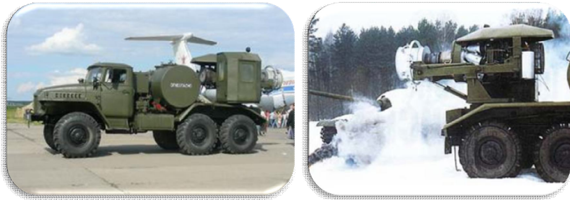
Рис. 3. Теплова машина ТМС-65

У зв'язку з цим привертає увагу досвід припинення групових порушень громадського порядку із застосуванням теплових машин типу ТМС-65 (рис. 3), розроблених для аеродромної служби, в одному з населених пунктів Росії. Такі машини здатні за допомогою турбореактивних авіаційних двигунів створювати потужний потік повітря до 600 м/с і тиск близько 3 атм, що є непереборним та безпечним для здоров'я людини повітряним бар'єром на відстані 25–35 м від машини.