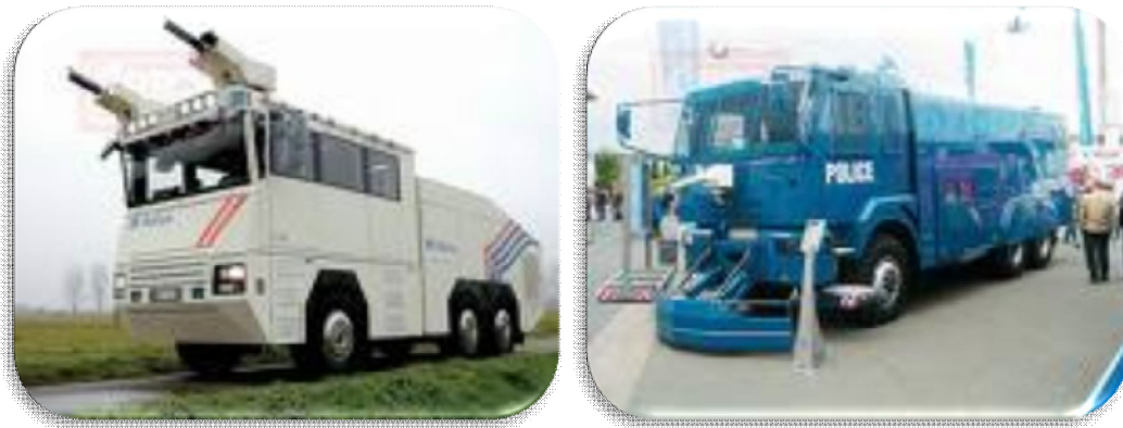
Рис. 1. Спеціальні водометні установки VID 8000 та RGU 6000

Вони, як правило, мають дві водяні пушки з дальністю стрільби близько 60 м. Установки оснащені баками, ємність яких: 2,5 – 12,0 тис. л води, 400 – 600 л сльозоточивого газу, 200 – 300 л емульгатора та 40 – 100 л фарби. Подача води здійснюється під тиском 14 атм у кількості 3,0 тис. л/хв. Також застосовують імпульсні водомети, що подають воду, сльозоточивий газ, барвники у таких режимах: