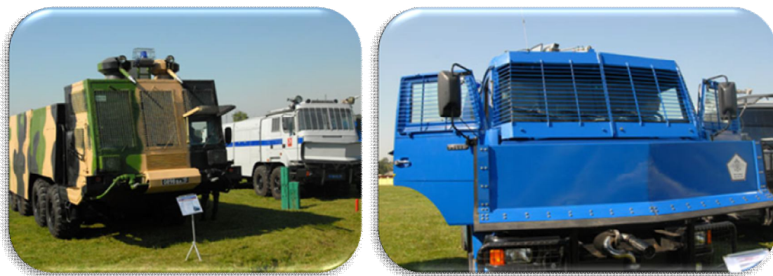
Рис. 2. Спеціальні водометні машини “Лавина” та “Шторм”

Підрозділи МВС Росії мають на озброєні спеціальні водометні машини “Лавина” та “Шторм” (рис. 2).