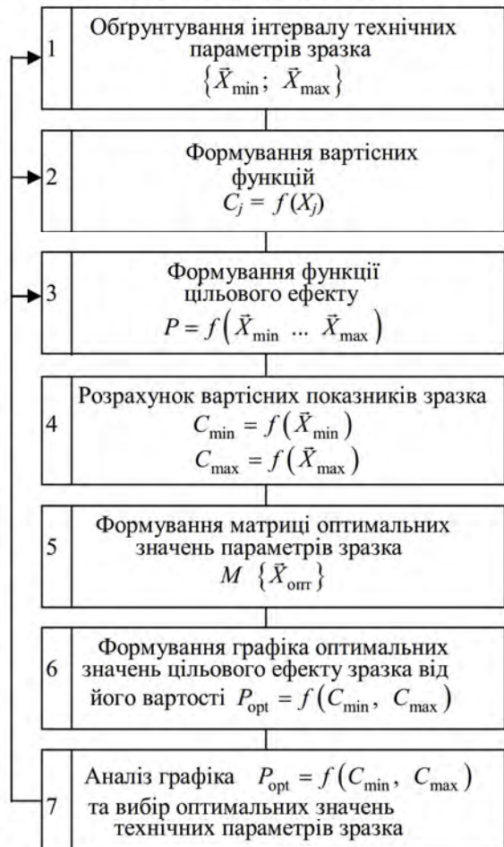
Рис. 1. Схема розв’язування задачі оптимізації параметрів зразка

У блоці 1 на підставі попереднього оперативнотактичного аналізу, а також наукових, технологічних, економічних можливостей обґрунтовуються значення