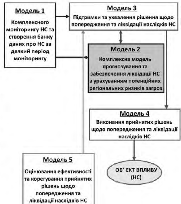
Рис. 1. Модель системи моніторингу, прогнозування та забезпечення ліквідації НС

Така модель (рис. 1) має бути однією з основних складових системи моніторингу, прогнозування та забезпечення ліквідації НС.