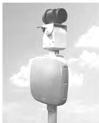
Рис. 5. Система огляду комплексу “Радескан”

Можна дійти проміжного висновку про освоєну однопозиційну (моностатичну) реалізацію засобів виявлення біологічних і інших об’єктів. Зазначимо, що про вартість