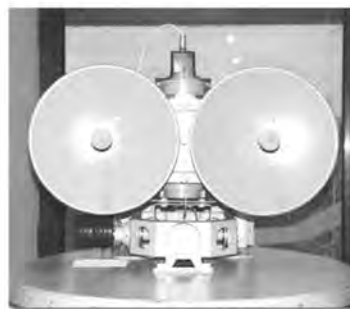
Рис. 2. Локатор “Лис”