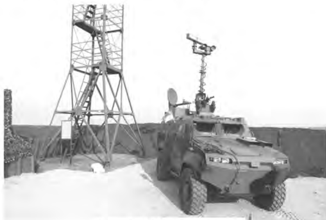
Рис. 3. РЛК “Джеб”

“Джеб” – мобільний комплекс наземної розвідки й радіоелектронної боротьби на базі броньованої машини (наприклад, “Тритон”) [5]. Він призначений для виявлення, класифікації й ідентифікації наземних рухомих цілей (у різних модифікаціях – повільних низьких цілей і об’єктів, що пересуваються по водній поверхні); проведення радіомоніторингу, радіоперехоплення й радіопротидії; цілевказування; виконання завдань з охорони протяжних територій і ведення розвідки (рис. 3).