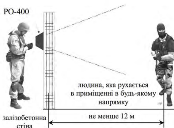
Рис. 4. Застосування РЛС РО-400

РЛС РО-400 призначена для виявлення людей за їх рухами й/або подихом за залізобетонними або цегельними стінами товщиною до 60 см (рис. 4) на відстані не менше 12,0 м. При цьому визначаються відстань до людей і їх кількість. Локатор працює на частоті близько 400 МГц [6].