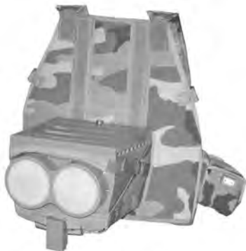
Рис. 1. Локатор “Борсук”

Коротко розглянемо характеристики основних засобів, представлених промисловістю. У цей час використовуються радіолокаційна станція (РЛС) розвідки наземних цілей ближньої зони 112L1 “Борсук” (рис. 1), радіолокатор розвідки наземних і малошвидкісних низьких цілей 111L1 “Лис” (рис. 2), мобільний комплекс наземної розвідки й РЕБ “Джеб”, РЛС виявлення людей за перешкодами РО-400, радіолокаційний комплекс для контролю обстановки в зоні об'єктів “Радескан”.