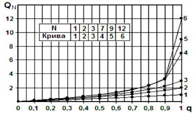
Рис. 2. Графік залежності Q_N = f(q)

Використання ЛЧШ передбачає оцінювання значення q як результату підрахунку в абсолютній шкалі кількості вірних відповідей на запитання, правильно виконаних завдань або розв'язаних задач, віднесених до їх (запитань, завдань, задач) загальної кількості. Контроль може бути усним, тестовим, у вигляді письмового опитування або контрольної роботи тощо.