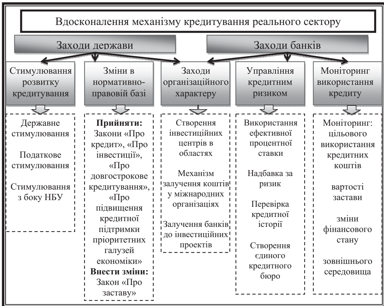
Рис. 2. Шляхи вдосконалення кредитування реального сектору економіки

через вдосконалення нормативно-правової бази в частині, що стосуються умов взаємодії банківських установ із виробничим сектором (рис. 2), а також закладення більш вигідних умов такої взаємодії в порівнянні з іншими секторами, зокрема на дотаційній чи привілейованій основі (запровадження нижчих регулятивних вимог до діяльності банків, звільнення від оподаткування коштів, які спрямовані на розвиток виробництва). Також з метою зниження кредитного ризику комерційних банків необхідно було б розробити механізм забезпечення таких кредитів за рахунок державних коштів (державні гарантії повернення позикових ресурсів) [2, с. 58]. В даному контексті доцільне створення державної страхової компанії, яка б тісно співпрацювала з банківськими установами, що здійснюють кредитування реального сектору.