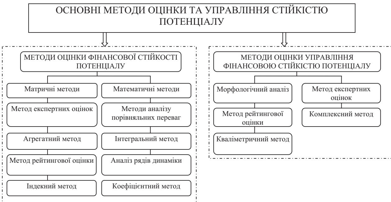
Рис. 2. Основні методи оцінки та управління стійкістю потенціалу

У сучасних підходах застосовують методи оцінки стійкості потенціалу, зокрема: матричні, інтегральні, визначення фінансової стійкості з точки зору стратегічного потенціалу підприємства, методи, що базуються на порівнянні з еталоном, графічні тощо [2; 4; 5; 9]. Слід зазначити, що серед наявних методів, так само, як і серед прийомів, переважна більшість відноситься до аналізу оцінки стійкості потенціалу, а не її управлінню. Так, до останніх належить лише метод морфологічного аналізу, за допомогою якого визначаються причинно-наслідкові впливи на стійкість потенціалу, що дозволяє формувати певні заходи з її управління. Інші методи, такі як матричні, математичні, експертних оцінок тощо, спрямовані здебільшого на здійснення аналізу факторів і показників, що допомагають оцінити стійкість потенціалу, не маючи можливості управління нею (рис. 2).