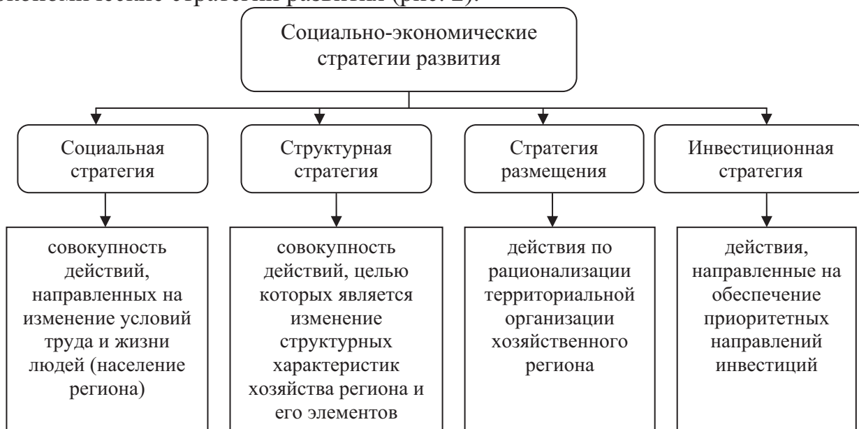
Рис. 2. Социально-экономические стратегии развития региона [5, с.128]

материальных благ, но и изменением ценностных приоритетов человека [6]. Как региональные, так и национальные цели в правительственных документах, программах и прогнозных материалах формируются как социально-экономические стратегии развития (рис. 2).