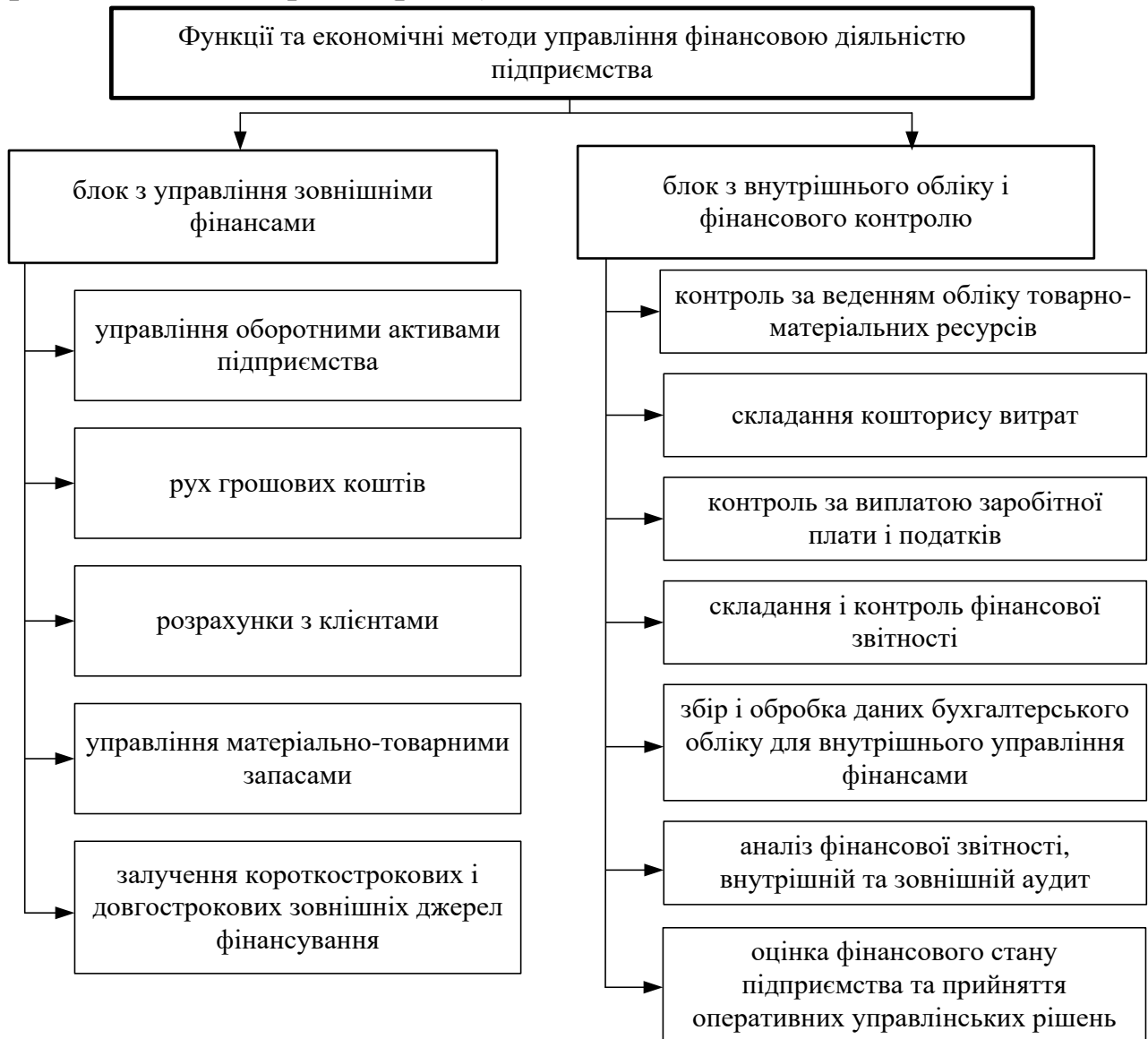
Рис.3. Функції й економічні методи управління фінансовою діяльністю підприємства

управління зовнішніми фінансами і блок з внутрішнього обліку і фінансового контролю (рис.3).