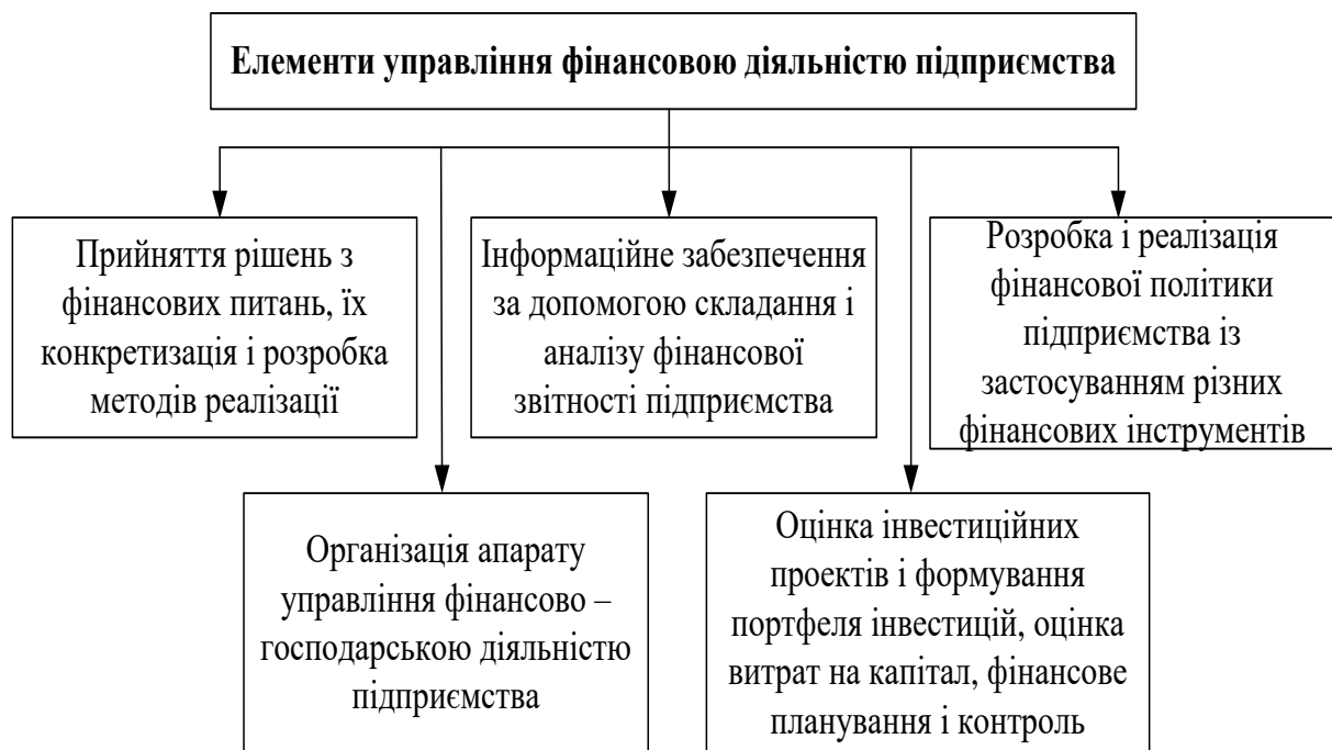
Рис.1. Елементи управління фінансовою діяльністю підприємства

Елементи, які включає управління фінансовою діяльністю підприємства, представлені на рис. 1.