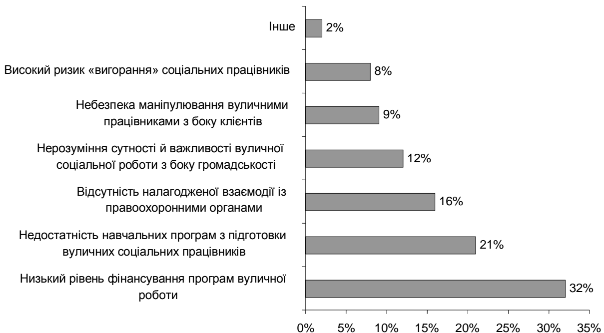
Рис. 5. Основні труднощі вуличної соціальної роботи

Результати контент-аналізу наведено на рис. 5.