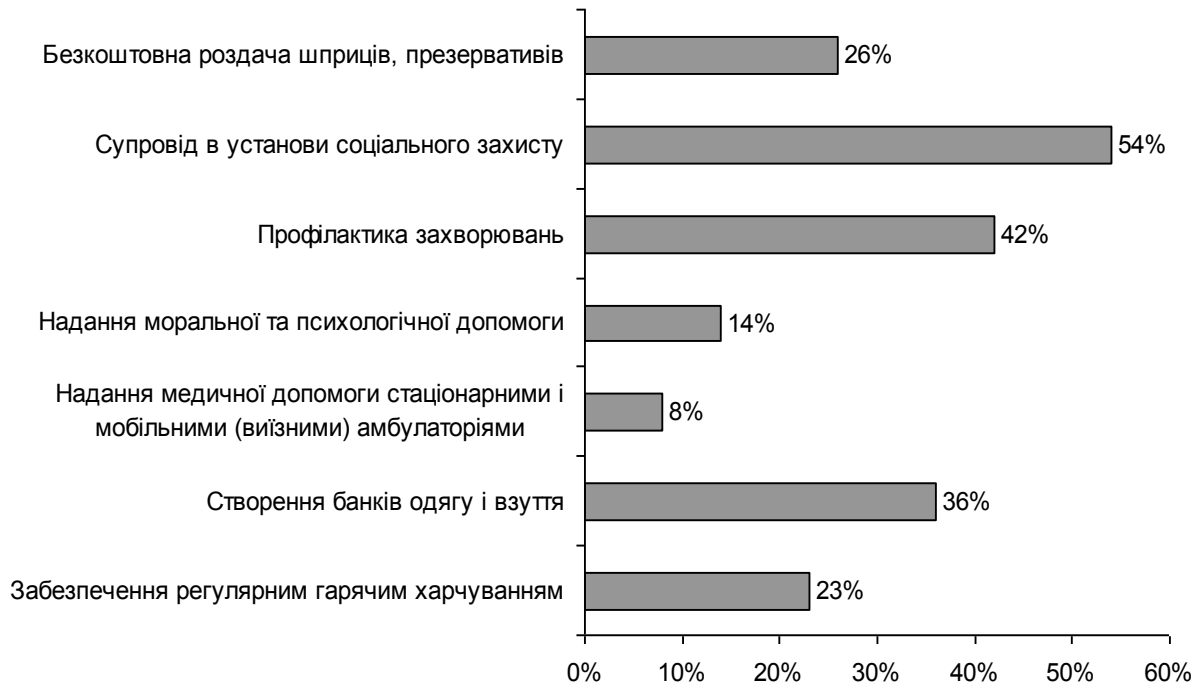
Рис. 3. Основні завдання вуличної соціальної роботи (можна було обрати декілька варіантів)

Серед основних принципів вуличної соціальної роботи експерти виділили такі (рис. 4).