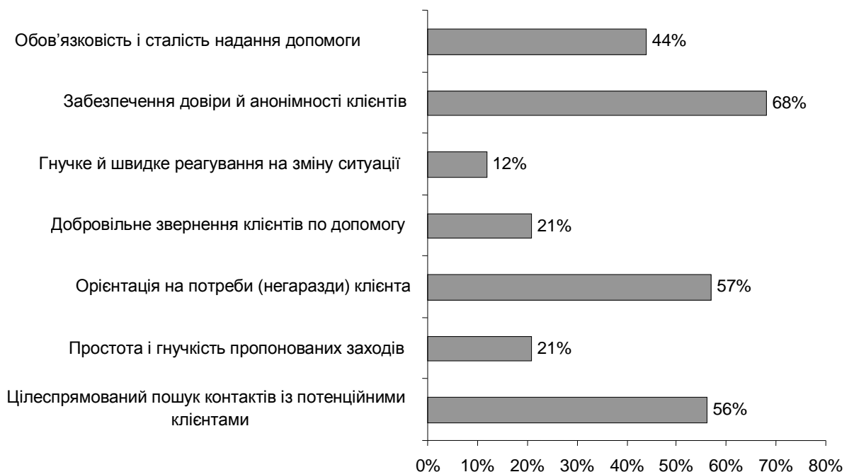
Рис. 4. Основні принципи вуличної соціальної роботи (можна було обрати декілька варіантів)

Серед основних принципів вуличної соціальної роботи експерти виділили такі (рис. 4).