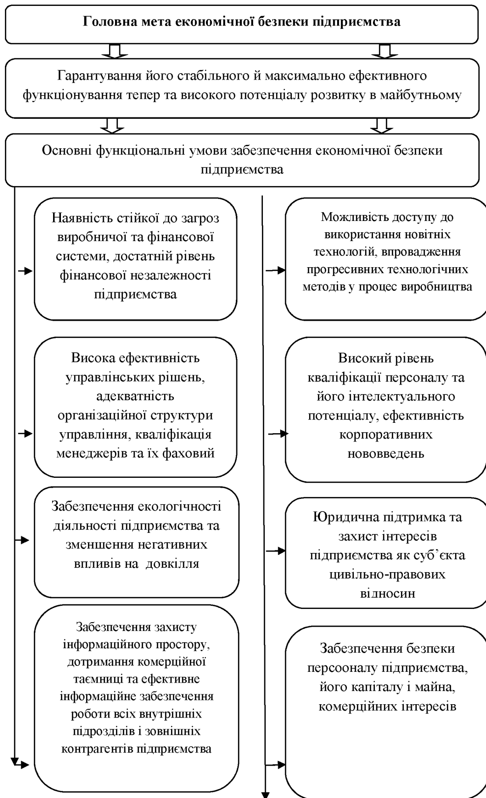
Рис.2. Мета й функціональні умови забезпечення економічної безпеки підприємства

Учені Б.М. Андрушків, О. Сороківська та ін. у своїх дослідженнях формують власне бачення головної мети економічної безпеки підприємства (рис. 2.) [1, с. 27].