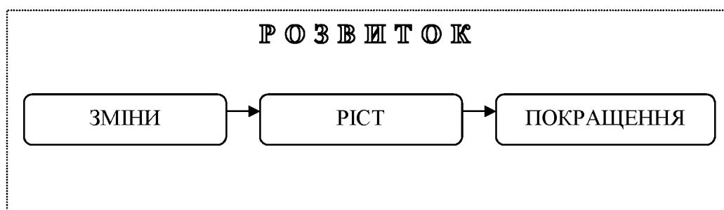
Рис. 1. Складові елементи процесу розвитку [4].

- розвиток – безповоротна, спрямована, закономірна, абсолютна і відносна зміна макро- і мікроекономічних показників, які характеризують економіку, матерію і свідомість. Так, в результаті розвитку виникає якісно нове розуміння об'єкта розвитку, його складу і структури. В будь-якому випадку під поняттям «розвиток» в основному розуміють певну прогресивну кількісну зміну – економічний ріст, або якісну зміну – структурні зрушення, зміни змісту розвитку чи набуття економічною системою нових характеристик. Поняття розвитку завжди має певну направленість, визначену ціль або їх систему. Воно включає в себе три взаємопов'язані елементи: зміни, ріст, покращення і, що найважливіше, лише при послідовному виникненні всіх вищенаведених складових можна стверджувати про повноцінний розвиток (рис.1).