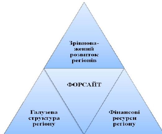
Рис. 2. Узагальнені вихідні дані для форсайту аграрних підприємств* *власне бачення автора

форсайт, як вихідну площадку для дослідження майбутнього всіма суб'єктами господарювання й політики (рис. 2).