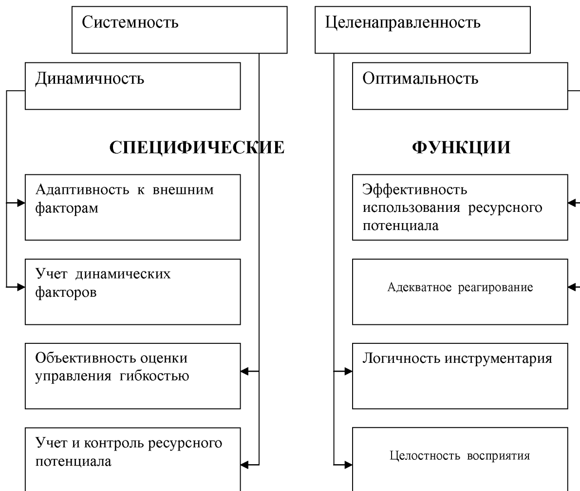
Рис. 2. Принципы управления гибкостью ресурсного потенциала субъектов реального сектора экономики

К общим принципам относятся: системность, целенаправленность, динамичность и оптимальность. Эти принципы являются основополагающими в целом для процесса управления. Каждый из общих принципов включает в себя специфические принципы, которые напрямую относятся к управлению гибкостью ресурсного потенциала субъектов реального сектора экономики.