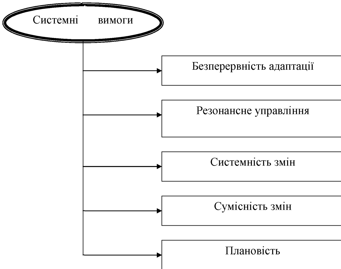
Рис. 2. Сукупність системних принципів адаптації банку

Висновки. Пропонується використати синергізм як галузь наукових досліджень для отримання додаткових можливостей управління за рахунок поєднання різного типу системних впорядкованостей. Критеріями дослідження та аналізу використання потенціалу ресурсів банку запропоновані впорядкованості: інформаційна, просторово-структурна та часова. Описані елементи адаптаційного механізму системного управління та особливості їх застосування в системі економічної безпеки банку.