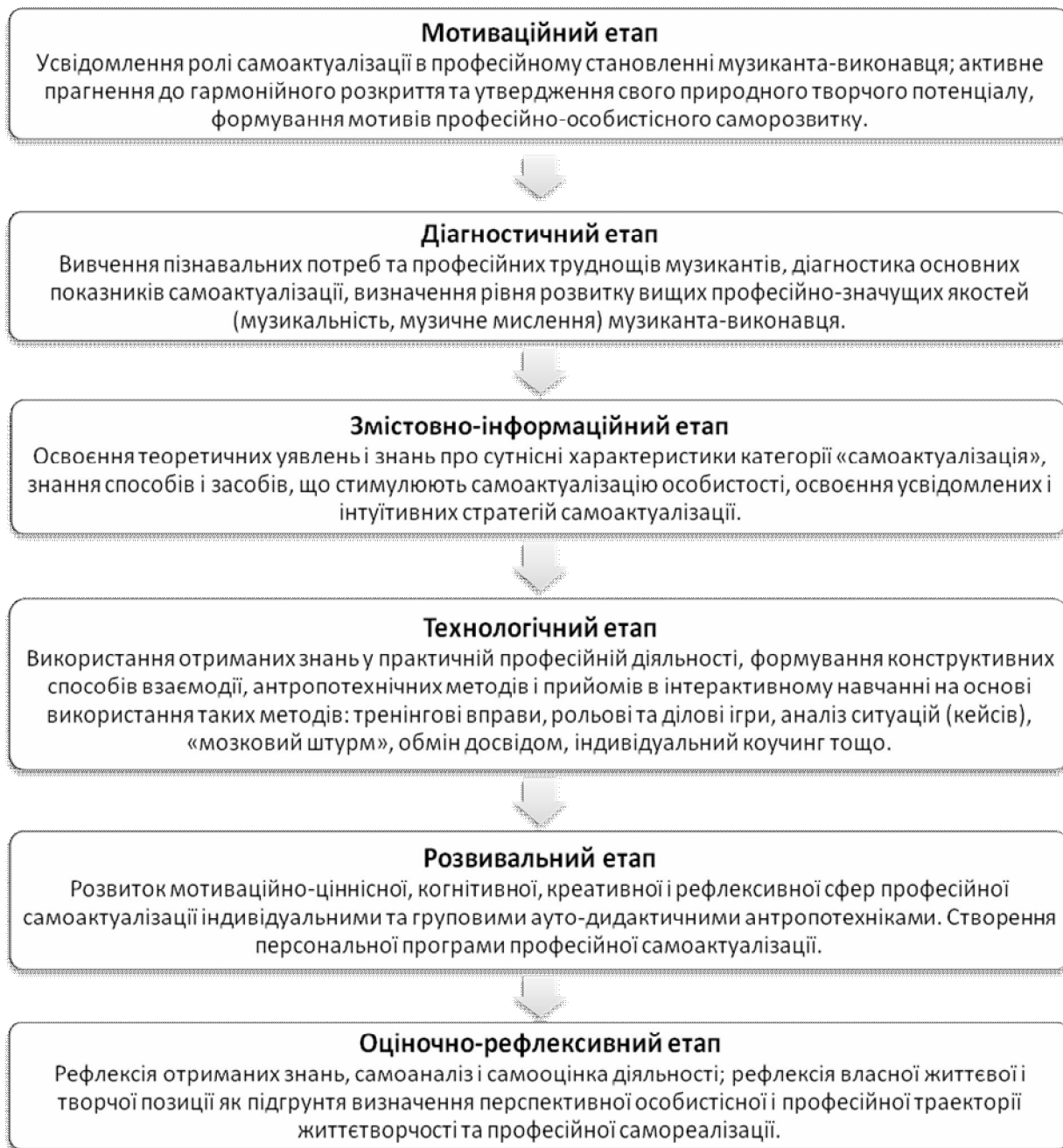
Рис. 2. Модель розвитку професійної самоактуалізації музиканта-виконавця в процесі професійної підготовки та самопідготовки

Етапи даної моделі постають структурно-тематичною базою для розроблення й апробації психорозвивальної програми, яка шляхом утілення визначених психолого-педагогічних умов служить антропотехнічним засобом розвитку професійної самоактуалізації музикантів-виконавців у процесі підготовки та самопідготовки. Це дає змогу забезпечити реалізацію визначених умов у практиці музично-виконавської діяльності та прослідкувати ефективність їх актуалізуючого впливу на динаміку зростання професійної самоактуалізації студентів-виконавців старших курсів музичних ВНЗ.