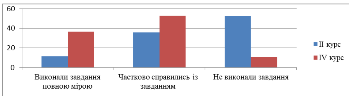
Рис.2. Результати відповідей на запитання іноземною мовою.

Зокрема, 52,5% респондентів II курсу взагалі виявились не готовими виражати свої думки іноземною мовою, 36% частково справились з роботою (зрозуміли завдання, висловили власну думку, припустившись при цьому грубих граматичних помилок) і лише 11,5% зрозуміли й виконали завдання в цілому правильно. Результати виконання завдання студентами IV курсу такі: 36,5% справились добре, 53% відповіли частково (коректно сформулювали висловлювання, допустивши незначні помилки, що в цілому не вплинули на зміст), 10,5% виявились не спроможними виконати завдання. Таким чином, результати засвідчують переважно задовільний та низький рівні підготовки майбутніх фахівців до міжкультурного спілкування, що вказує на необхідність більше уваги приділяти формуванню міжкультурної компетенції в процесі підготовки майбутніх фахівців.