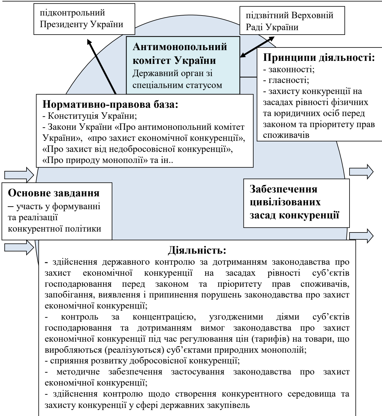
Рис. 1 Забезпечення державного захисту конкуренції антимонопольною діяльністю

Основним завданням Антимонопольного комітету України є участь у формуванні та реалізації конкурентної політики в частині [7]: