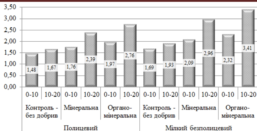
Рис. 1. Вплив елементів агротехнологій на коефіцієнт структурності (середнє за 2007–2010 рр.), для шару 0–10 см: НІР_{05}(\text{заг.})=0,20 , НІР_{05} (по фактору А)=0,12, НІР_{05} (по фактору В)=0,14; для шару 10–20 см: НІР_{05}(\text{заг.})=0,28 , НІР_{05} (по фактору А)=0,16, НІР_{05} (по фактору В)=0,20

Аналіз коефіцієнта структурності у шарі 0–20 см підтвердив перевагу мілкого безполицевого обробітку – приріст відносно полицевого на варіанті без внесення добрив становив 14,6%, а за умови внесення добрив – 21,2–21,4%.