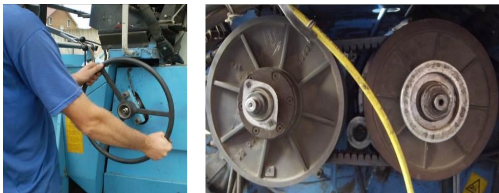
Рис. 2. Регулювання частоти обертів барабана молотарки з використанням варіатора

При проведенні досліджень розмір прохідних пазів між прутками деки встановлювався за рахунок варіювання кількістю прутків деки. Частота обертів барабана молотильного апарата регулювалась за допомогою варіатора (рис. 2). Зазор між декою і молотильним барабаном встановлювався ричагами з кабіни комбайнера.