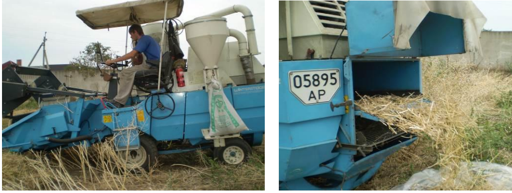
Рис. 3. Дослідження по визначенню якості роботи молотильного апарату комбайна при збиранні врожаю ріпака

Обробка результатів цих досліджень здійснювалась з використанням пакету програм Maple, Statistica та Mathematica з застосуванням регресивного та кореляційного аналізів.