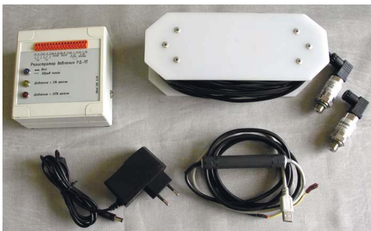
Рис.2. Комплектующие подсистемы измерения и регистрации давления

Подсистема видеонаблюдения построена с применением 4-х канального видеорежистратора USB DVR (рис.3) и компактной цветной видеокамеры (рис.3) с ИК-подсветкой SWP-CL600SD (разрешение 600 ТВЛ, матрица 1/3” Sony, влагозащищенное исполнение, фокусное расстояние 3,8 мм). Аппаратно и программно поддерживается подключение до 4 видеокамер. ИК-подсветка в применяемой видеокамере включается автоматически если внешний источник освещения отключается.