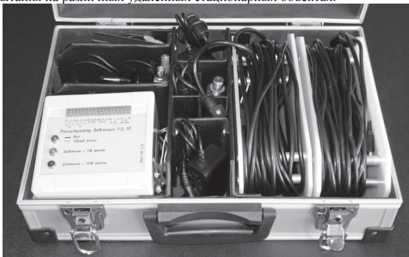
Рис.4. Транспортно-рабочая укладка регистратора

Транспортно-рабочая укладка регистратора (рис.4) имеет небольшие габариты и вес (385х280х125 мм, 4,6 кг), что позволяют проводить испытания на различных удаленных стационарных объектах.