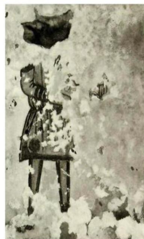
Мал. 2. Склеп № 2114/1904(18 53). Еле- менти роз- пису (по М. І. Ростовцеву)