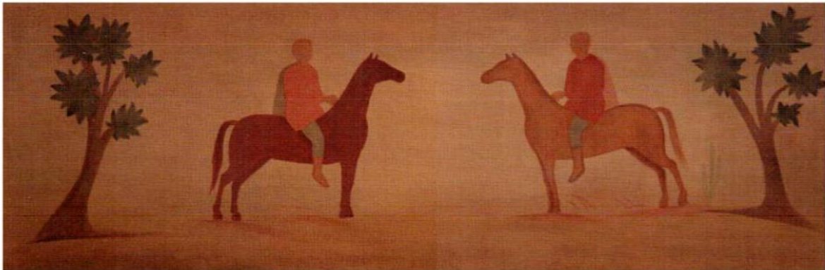
Мал. 6. Склеп № 2/2008. Два вершники (за: О. Рішетняк, О. Садова, Є. Туровський, А. Філіпенко)