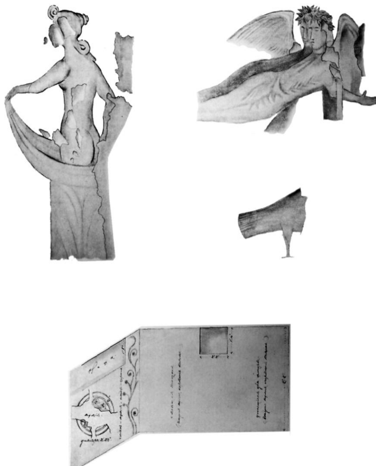
Мал. 1. Склеп № 511/1894. Елементи розпису (по М. І. Ростовцеву)