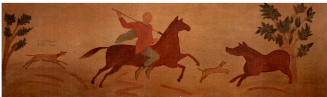
Мал. 7. Склеп № 2/2008. Сцена полювання на кабана (за: О. Рішетняк, О. Садова, Є. Туровський, А. Філіпенко)