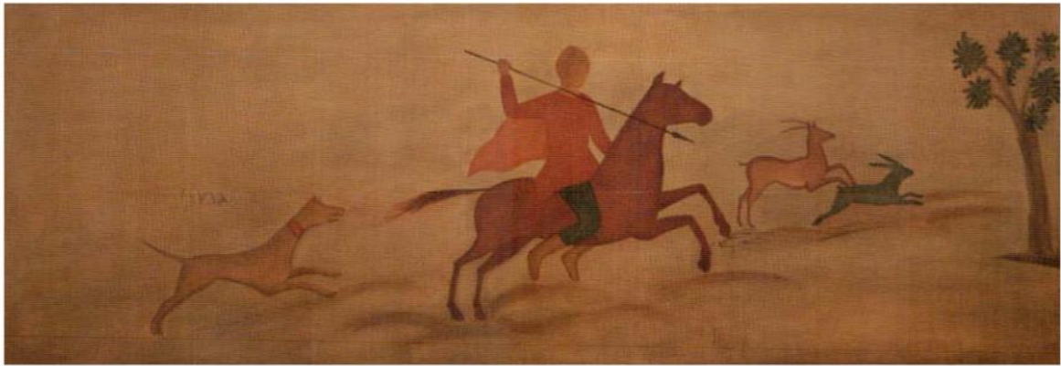
Мал. 5. Склеп №2/2008. Сцена полювання на козулю та зайця (за: О. Рішетняк, О. Садова, Є. Туровський, А. Філіпенко)