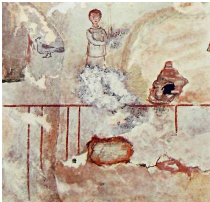
Мал. 3. Склеп 1909 г. Фігура. Елементи розпису (по М. І. Ростовцеву)