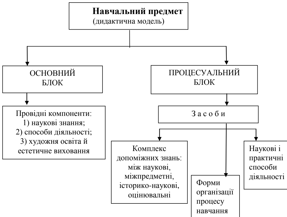
Рис. 1. Загальнодидактична модель навчального предмета.

або процесуальний блок , що забезпечує засвоєння знань, формування різних умінь і навичок, розвиток і виховання (рис 1 ).