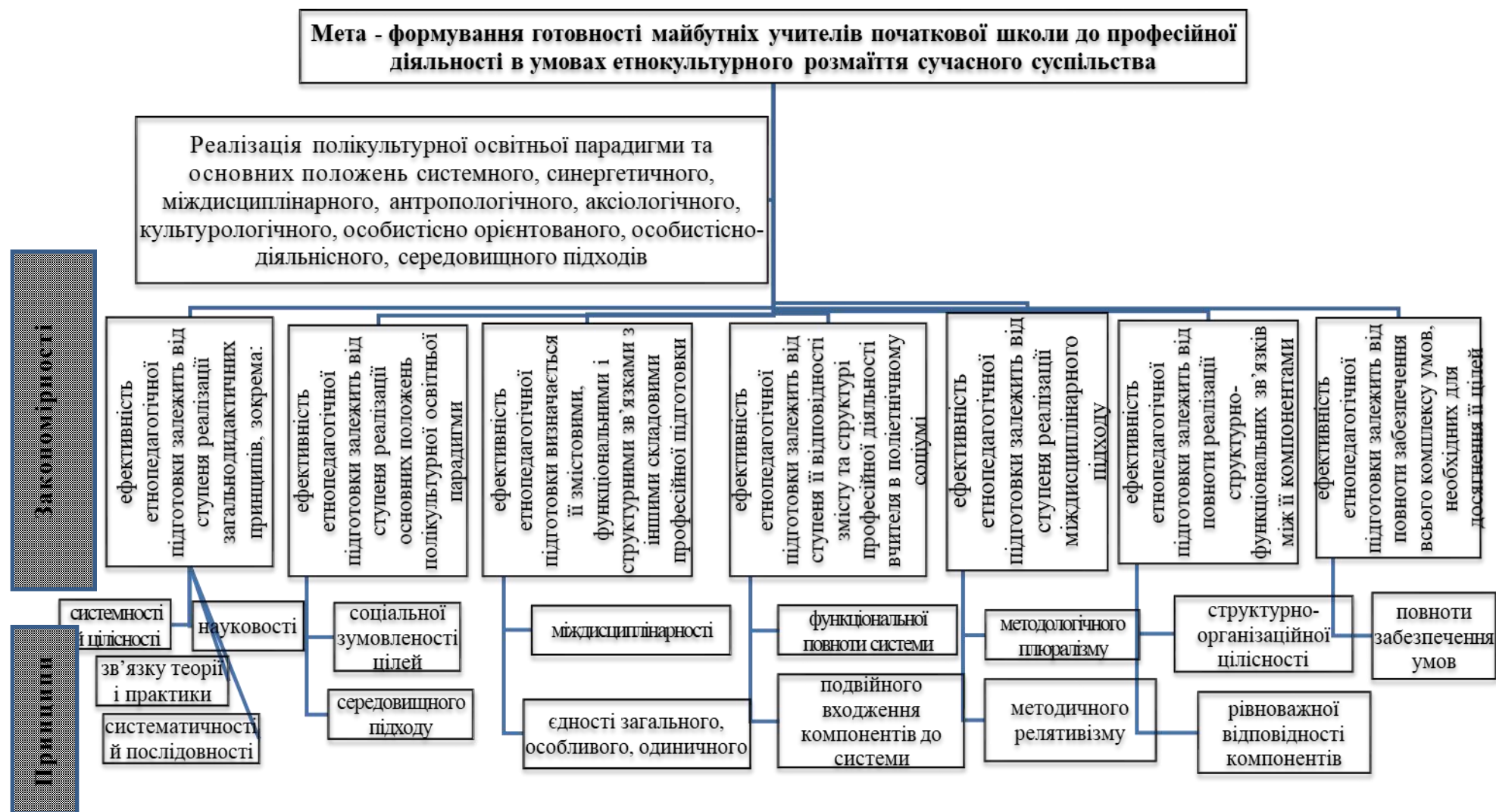
Рис. 1. Концептуальна субмодель професійної підготовки майбутніх учителів початкової школи на засадах порівняльної етнопедагогіки