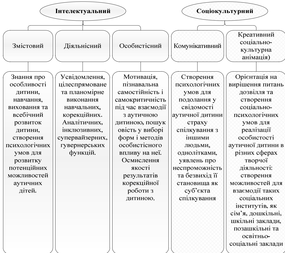
Рис. 1. Структура готовності майбутнього фахівця до роботи з аутичними дітьми.

Структура готовності до корекційно-виховної діяльності майбутнього фахівця