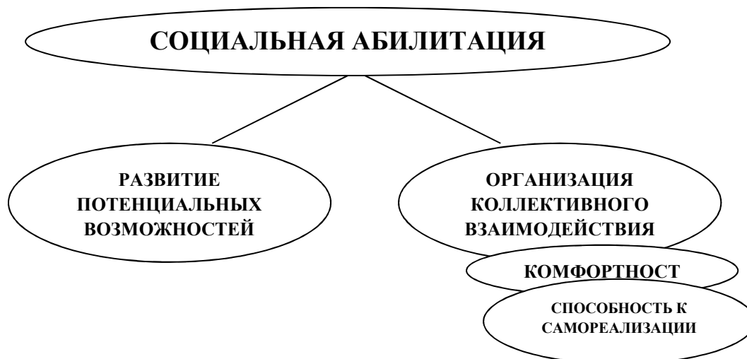
Рис. 3. Конструкт процесса социальной абилитации детей с ТНР

Усилия следует направить и на развитие потенциальных возможностей детей с ТНР в целях активного участия во всех аспектах жизни социума, и на такую организацию коллективного взаимодействия, которая обеспечит детскую комфортность и способность к самореализации. Таким образом, процесс социальной абилитации условно можно представить в виде определенного конструкта (рис. 3):