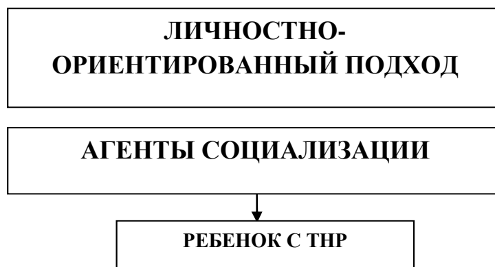
Рис. 2. Схематическое отражение личностного подхода

Важным представляется не только знание особенностей протекания психических процессов, но и характерологических свойств личности. Лишь адекватный учет этих сведений позволит эффективно использовать технологию личностно-ориентированного подхода. Актуальность данной технологии определяется и тем фактом, что отрицательное влияние на психическое развитие ребенка с ТНР оказывает недостаток контактов с окружающими, а личностный подход включает непосредственное эмоциональное общение ребенка и с родственниками, и с педагогами (агентами социализации), придающее ему структурный характер (рис. 2):