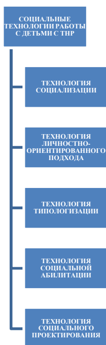
Рис. 6. Система социальных технологий

Арсенал социальных технологий обширен и разнообразен. В статье представлены лишь некоторые из них, имеющие (по мнению автора) особую актуальность в педагогическом процессе с детьми с ТНР. С целью систематизации рассмотренных социальных технологий предложим следующий конструкт (рис. 6):