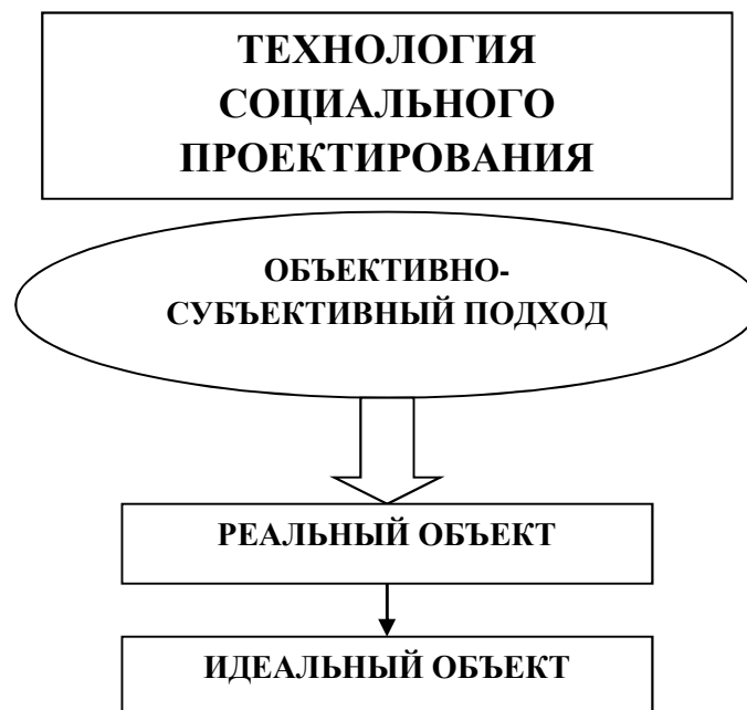
Рис 4. Структура технологии социального проектирования при работе с детьми с ТНР

Использование технологии социального проектирования в работе с детьми, имеющими ТНР, предполагает в качестве ориентира как реальный, так и идеальный объекты. Реальный – то, что имеется в настоящий момент; идеальный – то, что желательно для достижения в процессе специальной работы. Реальный объект служит тем образованием, на основании которого будут в последующем формироваться новые социальные достижения, характеризующие объект идеальный. Таким образом, технология социального проектирования при работе с детьми с ТНР имеет вид своеобразной структуры (рис. 4):