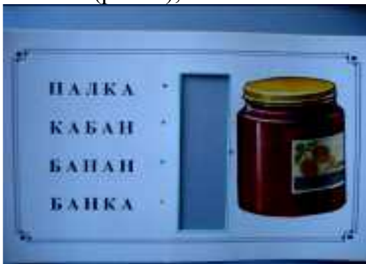
Рис.7 Читай внимательно слова и выбери название картинки