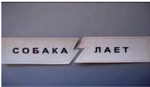
Рис.6 Составь словосочетание