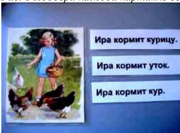
Рис. 9 Подбери предложение к картинке