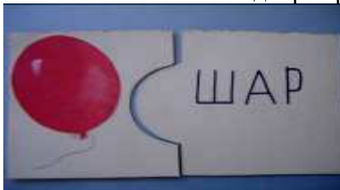
Рис. 4 Прочитай слово и подбери картинку