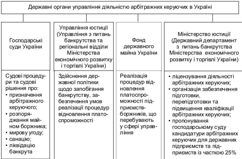
Рис. 1. Розподіл основних функцій управління між суб'єктами державного управління щодо банкрутства в Україні

керуючих тимчасово здійснює Державний департамент з питань банкрутства Міністерства економічного розвитку і торгівлі до завершення виконання заходів, що забезпечать можливість здійснення Міністерством юстиції таких повноважень (рис. 1).