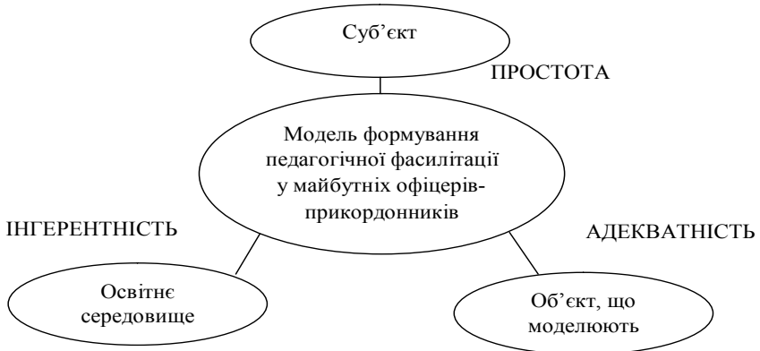
Рис. 1. Вимоги, що висуваються до моделі формування педагогічної фасилітації у майбутніх офіцерів-прикордонників (за В. Волковою [1])

ність), суб'єкт, що створює модель (простота) та модельований об'єкт (адекватність) (рис. 1).