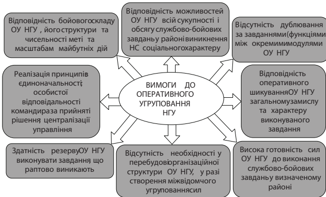
Рис. 2. Вимоги до оперативного угруповання НГУ, створюваного для виконання службово-бойових завдань із забезпечення громадської безпеки

Оперативний масштаб завдань, що виконуються Національною гвардією України для забезпечення громадської безпеки, їх складність, небезпека наслідків, що можуть настати у разі виникнення НС соціального характеру, зумовлених масовою активністю громадян, висувають до створюваних ОУ НГУ низку вимог (рис. 2).