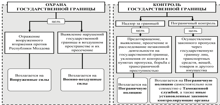
Рис. 3. Особливості забезпечення прикордонної безпеки відповідно до Закону “Про державний кордон РМ” (2011 рік)

Особливості законодавства РМ, що регламентує діяльність прикордонних відомств у різні періоди, подано у табл. 3.