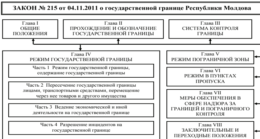
Рис. 2. Структура Закону “Про державний кордон РМ” (2011 рік)