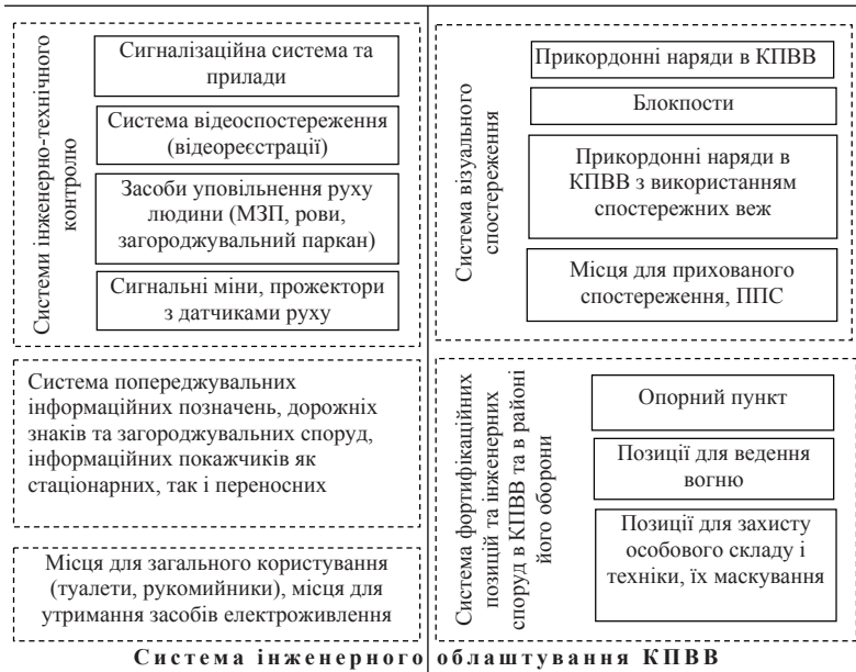
Рис. 2. Схема системи інженерного облаштування контрольного пункту в'їзду-виїзду

Для виконання зазначених умов виконання завдань на КПВВ створюється відповідна система інженерного облаштування КПВВ (рис. 2).