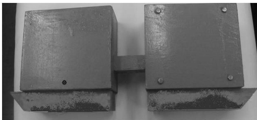
Рис. 1. Картина распределения поверхностной температуры (индикатор ТИП-122)

Первая серия экспериментов предусматривала разгон локомотива с сцепной частью общей массой 60 т до скорости от 1 до 3 м/с и торможение с применением различных схем включения тормозных механизмов. Как и предполагалось, наибольший нагрев секций наблюдался при торможении рельсовым магнитным тормозом при наклоне тяг системы подвешивания более 30 °. На рис. 1 представлены картины температурного поля первой и второй секций после интенсивного торможения на участке пути длиной 180 м, время торможения составило 168 с, уклон пути равнялся 10 ‰. Анализ результатов показал, что наибольший нагрев возникает в передней части тормозной секции, причем передняя по ходу движения секция нагревалась более интенсивно.