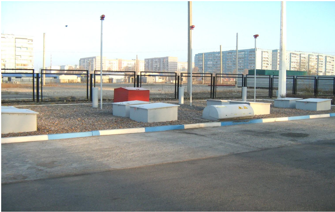
Фото 1. Дихальні клапани на АЗС

Паливні колонки оснащені трубопроводами примусового повернення пароповітряної суміші, яка утворюється в еластичних шлангах. Приймальні пристрої резервуарів забезпечують герметичний злив палива з використанням зливних швидкокорозійних муфт.