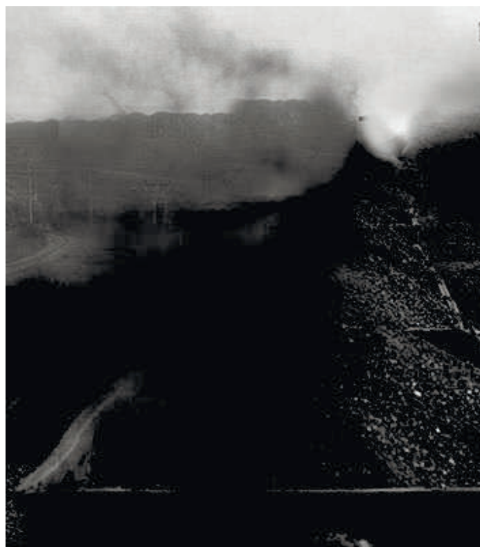
Рис. 2. Снос угольной пыли из полувагонов