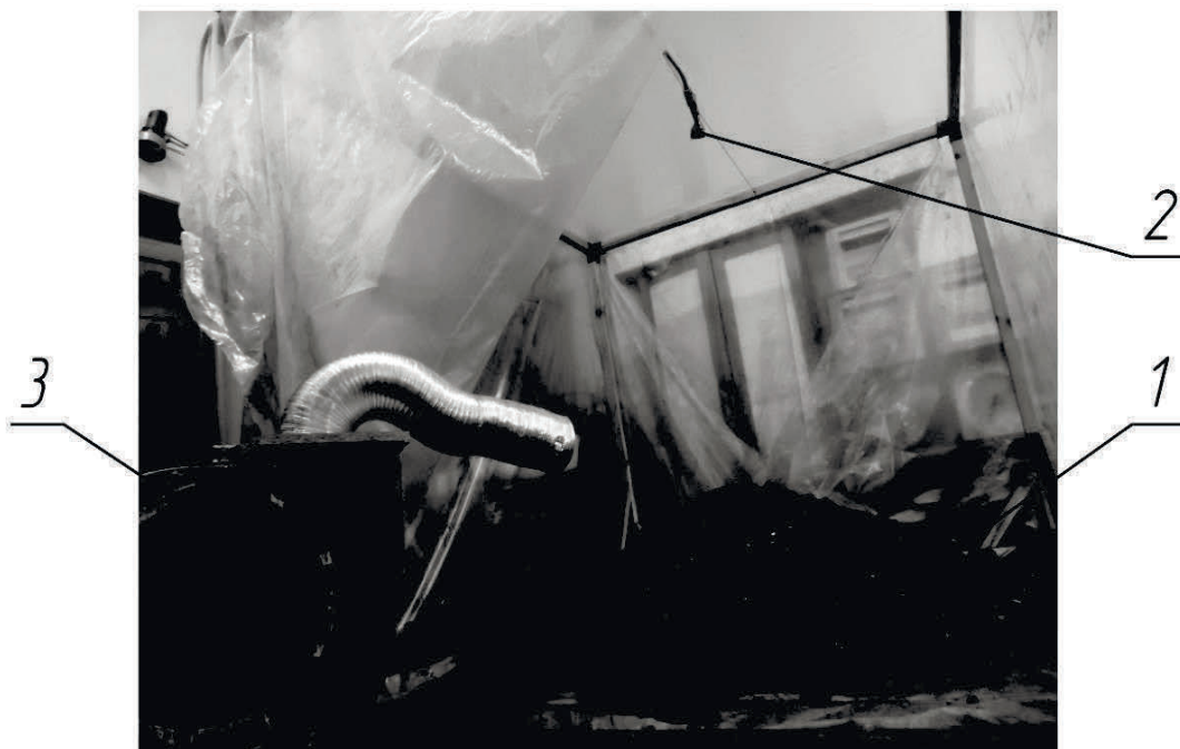
Рис. 4. Схема экспериментальной установки: 1 – угольный штабель, 2 – форсунка, 3 – воздуходувка