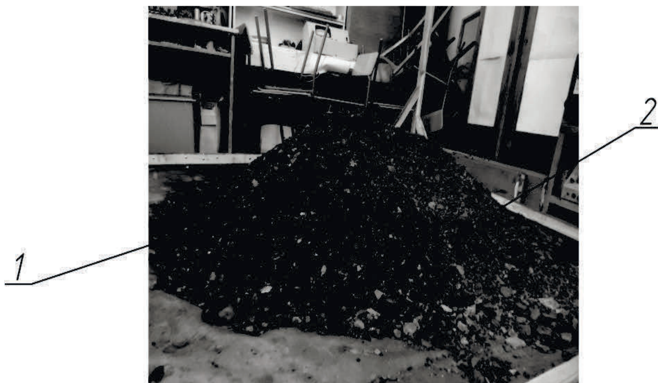
Рис. 5. Угольный штабель в эксперименте: 1 – зона, покрытая специальным раствором; 2 – зона, не обработанная раствором

На рис 5 показан угольный штабель, одна часть которого покрыта разработанным составом, а другая часть – нет.