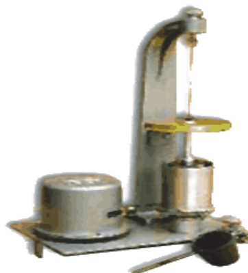
Рис. 2. Прибор СНС-2

В стакан заливается испытуемый раствор. При вращении стакана раствор увлекает за собой находящийся в нем цилиндр измерительный и всю подвешенную систему до тех пор, пока момент закручивания нити не станет равным крутящему моменту, развиваемому статическим напряжением сдвига раствора на цилиндр. Статическое предельное напряжение определяется по максимальному углу закручивания нити.