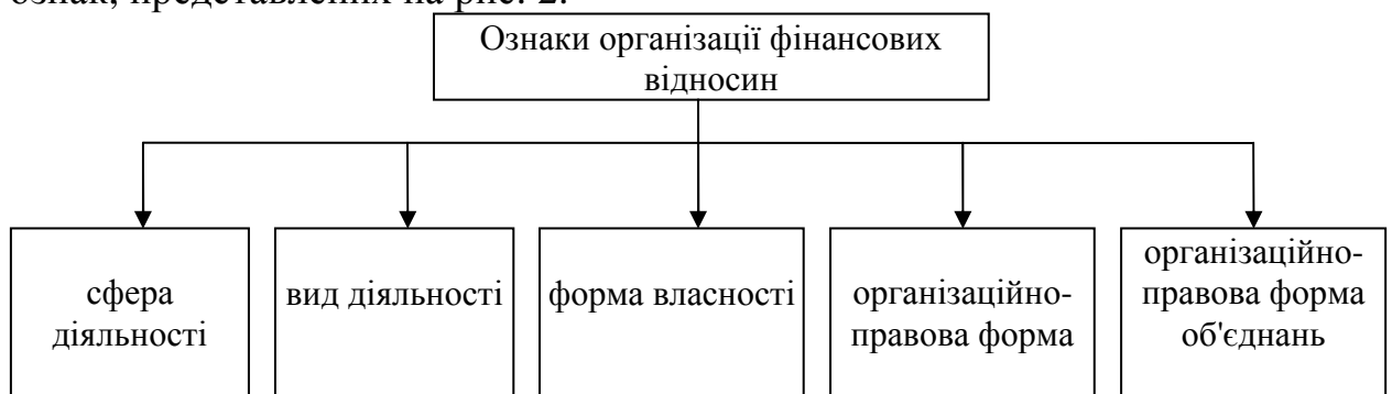
Рис. 2. Головні ознаки організації фінансових відносин*

Водночас фінанси за сутністю не тільки засіб управління, але й об'єкт управління, тобто керована система. Об'єктом управління у фінансовому механізмі є система фінансових відносин, від форм організації яких залежить «конструкція» фінансового механізму, склад і його кількісні параметри. Форма організації фінансових відносин підприємств визначається сукупністю ознак, представлених на рис. 2.