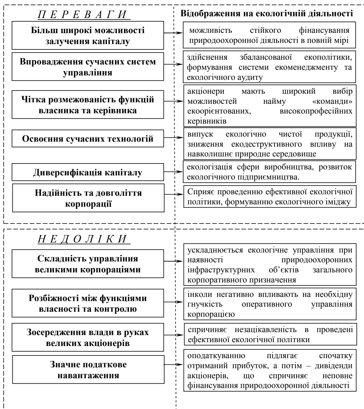
Рис. 1. Систематизація переваг та недоліків функціонування корпорацій з точки зору раціоналізації їх екологічної діяльності

Аналізуючи корпоративний сектор України, слід відмітити, що акціонерні товариства (корпорації) як організаційно-правові форми вже одержали достатнє поширення та розвиток. Першими корпораціями на Україні стали холдинг «Азовмаш» (1991 р.), судноплавна компанія «Укррічфлот» (1992 р.), хімічний концерн «Стірол» (1995 р.) та інші. Зазначимо, що більшість АТ розташовано у великих промислових регіонах, де зосереджена металургійна, добувна, обробна, хімічна, машинобудівна промисловість. Слід відмітити, що приведені галузі народного господарства є найбільш енерго- та ресурсоємними і відповідні виробництва характеризуються значним рівнем екодеструкції.