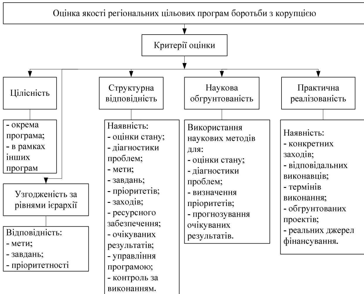
Рис. 3. Оцінка якості регіональних цільових програм боротьби з корупцією

За результатами проведення експертної оцінки та розрахунку інтегрального показника якості програм боротьби з корупцією України (табл. 3) зроблено висновок, що з 22-х обласних програм, які аналізувалися, 3 програми (Волинської, Луганської та Херсонської областей) мають найгірший рівень якості, вони не повинні були впроваджуватися. Ці програми не відповідають цілям державної Комплексної програми профілактики правопорушень та Національній програмі боротьби з корупцією, структурі і встановленим критеріям якості програм та за визначеною шкалою не можуть бути впроваджені або їх слід переробити повністю.